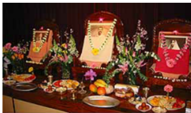
The Shrine - Specially Decorated